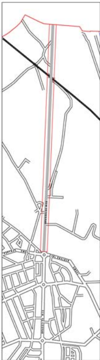
Figuur 1 Brusselseweg